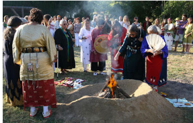
19 DE JULIO DE 2008 - ENCENDIDO DEL FUEGO DE LAS ABUELAS EN EUROPA EN BORJA, ZARAGOZA - FOTO MARISOL VILLANUEVA.