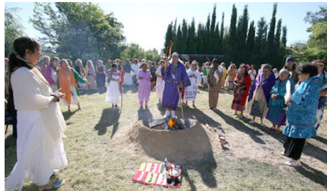
19 DE JULIO DE 2008 - ENCENDIDO DEL FUEGO DE LAS ABUELAS EN EUROPA - FOTO MARISOL VILLANUEVA.

Arboleda de Gaia, continúa guardando este fuego. En él activaremos el 3 de febrero el Fuego de las Mujeres, por el bien de todos los seres sintientes.