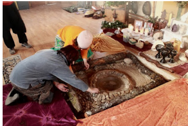
16 h. Preparando el fuego en el oratorio