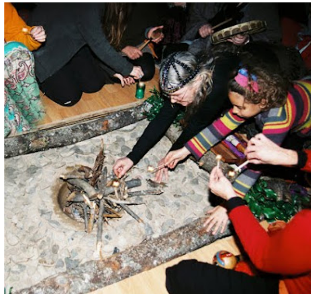
20 h. Iluminando el Fuego de las Mujeres.